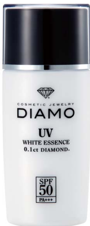
ディアモ UV ホワイトエッセンス 3,150円（税込）

紫外線は肌に悪影響を及ぼし、老化の原因といわれています。紫外線対策をしながら、エイジングケア成分や美肌成分で毎日のお手入れができる『ディアモ UV ホワイトエッセンス』は、年間を通して安心してお使いいただけるアイテムです。